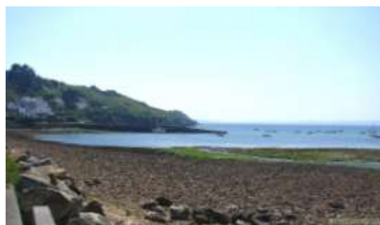
Anse du Caro

Plougastel dispose de nombreuses infrastructures de qualité pour permettre à tous ses habitants de se livrer à une multitude d'activités de loisirs, culturelles (Espace Avel Vor, médiathèque Anjela Duval, cinéma l'Image, bocal à musique, musée de la fraise et du patrimoine, musée du sapeur-pompier) ou sportives (Avel Sport, Roz Avel, terrain de foot synthétique, piste de BMX, bowl, skate et city park...)