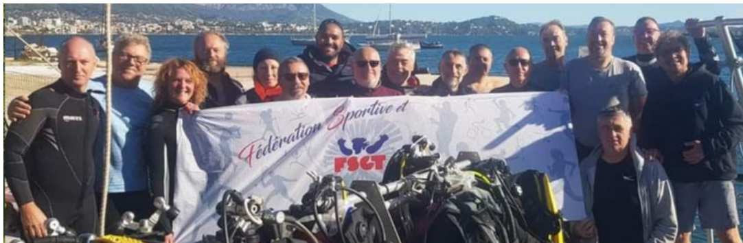
Stage Fédéral des Haut de France 2023